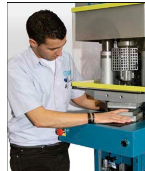
Die BOY XS V ergänzt das BOY-Produktprogramm an Umspritzautomaten. Sie bietet auf 0,63 m 2 alle konstruktiven Vorzüge unserer erfolgreichen vertikalen Maschinenkonfiguration.

Ideal für Mikro- und Einkavitätenspritzguss in Thermoplasten und Elastomeren.